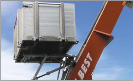
Traploze verstelspindel 17-87° (optioneel)