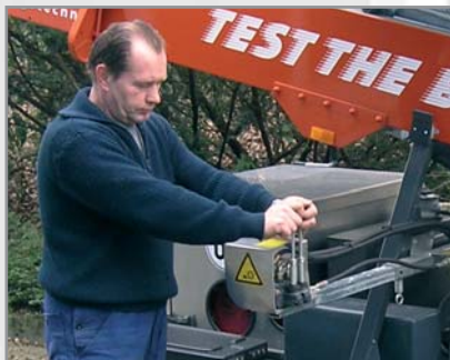
Bediening van de zelfaandrijving