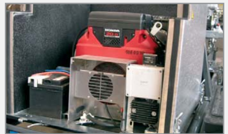
Bijzonder krachtige motoren (bijv. Honda GX 620) met Turbo schakelaar