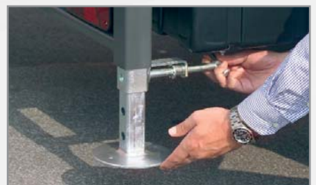
Gegalvaniseerde valstempels met schroefspindel