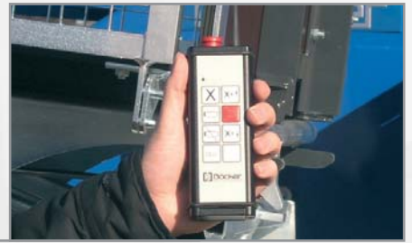
Elektrische bediening vast in kopstuk of met draadloze handzender (optioneel)