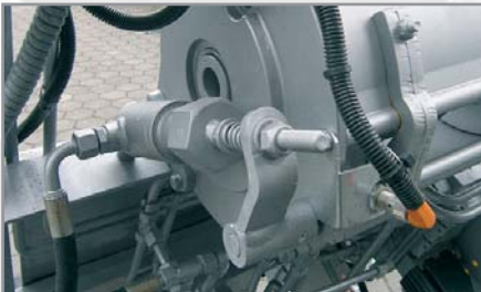
Automatische, hydraulische klinkvergrendeling (optioneel)