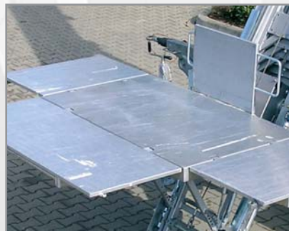
Volledig effen meubelplateau