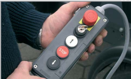
Elektrische besturing met kabel