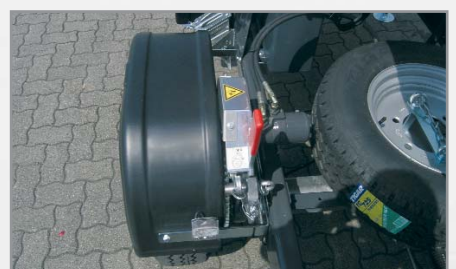
Passende, krachtige zelfaandrijving (optioneel)