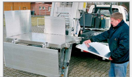
Zijwanden om te klappen 90°/180° en volledig uitneembaar