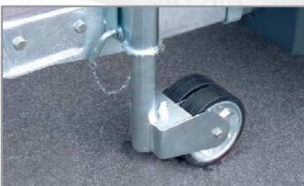
Stevig steunwiel (optioneel als dubbele steunwiel)